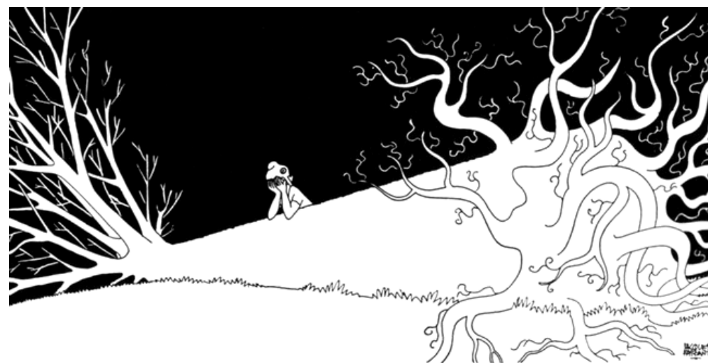
9 novembre 1970 - Mort du général de Gaulle