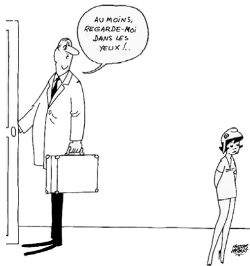
28 avril 1969 - Après l'échec du référendum sur le Sénat, de Gaulle démissionne