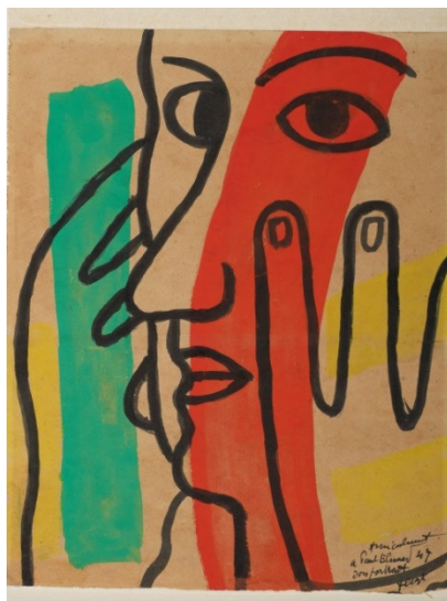
Fernand Léger, Paul Eluard (1947)

Collectionneur et ami des artistes, Paul Éluard (1895-1952) a nourri sa poésie au feu de l'art moderne et du communisme. Afin de poursuivre l'exploration des amitiés fructueuses que le poète a entretenues avec ses contemporains Man Ray et Picasso, le musée d'art et d'histoire de Saint-Denis s'associe au musée national Fernand Léger de Biot (Alpes-Maritimes), pour vous présenter une exposition temporaire explorant les points de rencontre entre Léger et Eluard.