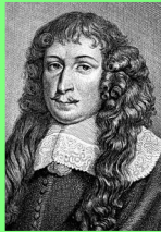
Jean Regnault de Segrais (1624-1701)