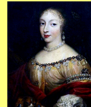
Henriette d'Angleterre (1644-1670)