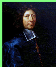
Pierre-Daniel Huet (1630-1721)