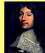
François duc de La Rochefoucauld (1613-1680)