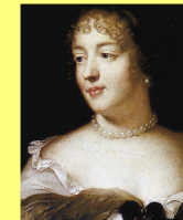
Marquise de Sévigné (1626-1693)