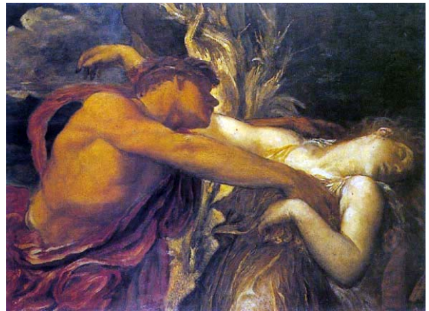
2/ Le veuf inconsolable George Frederick Watts - Orphée et Eurydice , 1869