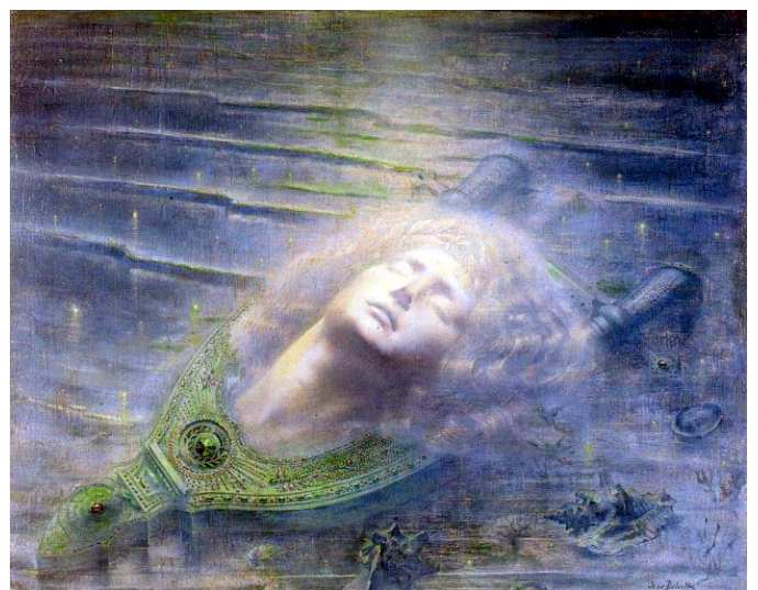
6/ La tête qui, miraculeusement, continue de chanter Jean Delville - Orphée , 1893