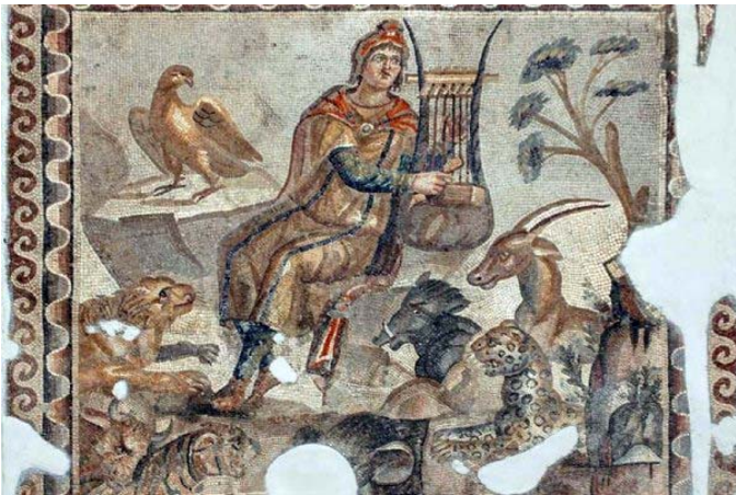
1/ Le musicien capable de charmer même les bêtes sauvages Mosaïque romaine - 275-300 apr.JC - Musée d'Antioche