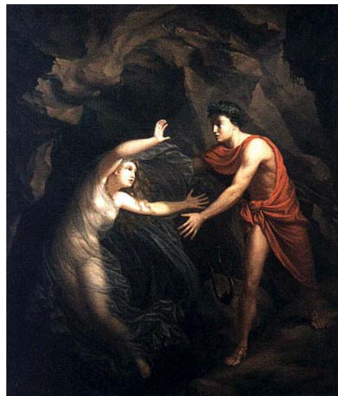
4/ L'imprudent qui perd Eurydice pour la deuxième fois Ch. Gottlieb Kratzenstein-Sub - Orphée et Eurydice , 1806