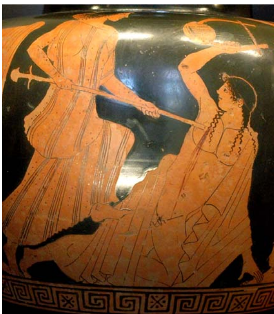
5/ La victime des Ménades déchaînées Mort d'Orphée, stamnos à figures rouges, 470 av.JC - Louvre